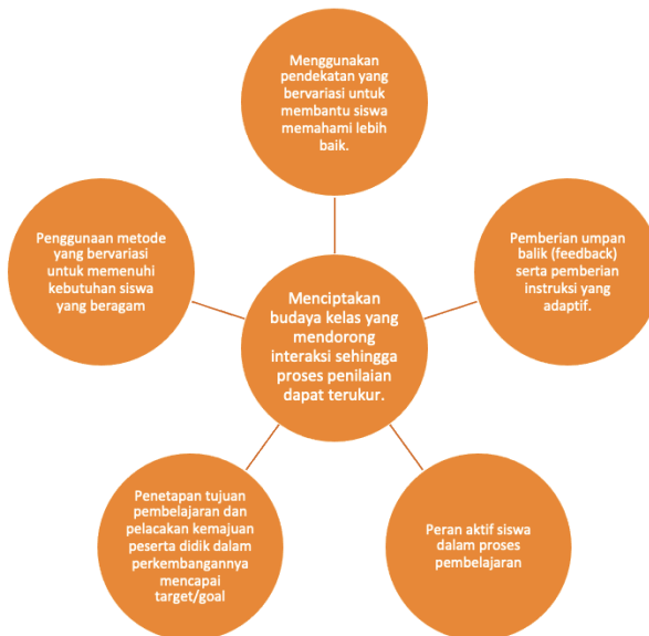
Gambar 2. Enam elemen utama dalam penilaian formatif.

OECD (2008) menyebutkan terdapat enam unsur utama dalam penilaian formatif, seperti terlihat pada gambar dibawah ini.